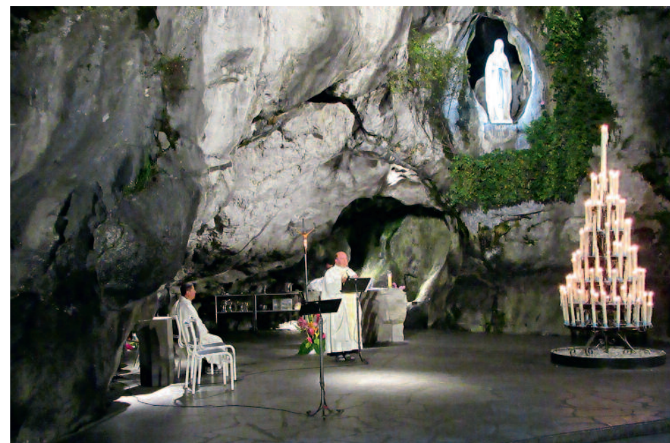
Morgens früh um 6 Uhr bei der heiligen Messe an der Grotte.