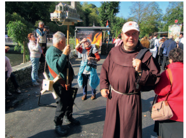
Die Liebe zu Jesus ist in der Gelassenheit der Pilger sichtbar.

Am Nachmittag fand die Spendung der Krankensalbung statt. Pater Fidelis erläuterte uns, dass die Krankensalbung eine dreifache Wirkung hat. Zum einen stärkt es den Gläubigen, zum zweiten heilt es ihn an Seele und Leib, wie es für ihn am besten ist. Und zum dritten hat sie die Sündenvergebung zur Folge. Sie ist aber nicht gedacht, das Bussakrament zu umgehen. Die Beichte zur Krankensalbung ist daher empfehlenswert, damit sich dem Priester die Möglichkeit ergibt, dem Gläubigen einen vollkommenen Ablass zu spenden.