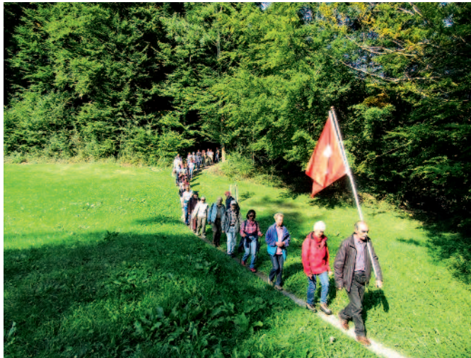
Durch Wald und Wiesen bei schönstem Wetter dem Ranft entgegen.