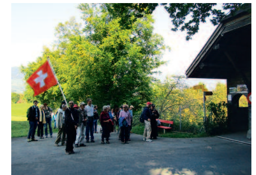
Bei der «Hohen Brücke» haben wir gebetet.

Nach der Rückkehr aus dem Alten Zürichkrieg, fühlte sich Niklaus von Flüe bereit für