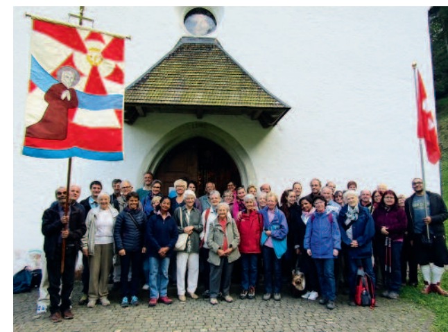
Eine beachtliche Anzahl Pilger nahm an unserer 11. Fusswallfahrt teil.