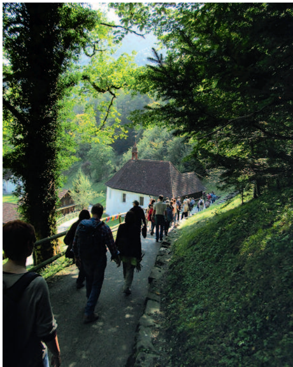
Bald ist das Ziel erreicht. Wir freuen uns auf die hl.Messe.