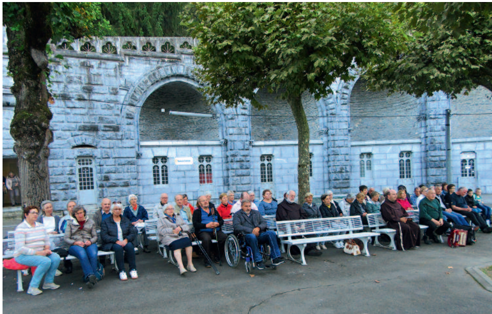
Die Pilger beten gemeinsam und gesammelt den Rosenkranz.

Wenn ein wichtiger und liebenswerter Besuch kommt, freuen wir uns, sind vielleicht aufgeregt und möchten, dass sich unser Gast wohlfühlt. In der Hl. Schrift kündigt Gott an, dass er kommen wird. Das heisst, wir leben nicht auf den Tod hin, sondern auf das Kommen Christi. So können wir uns darauf vorbereiten und ausräumen, was stört. Hier in Lourdes können wir das Evangelium neu hören und wie ein Kind annehmen. So ist Gott ganz nahe. Wir haben dazu viele Möglichkei-