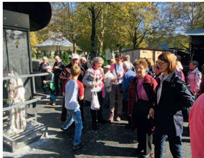
Unsere Lebenskerze soll nicht ohne Liebe zu Gott und den Menschen enden.