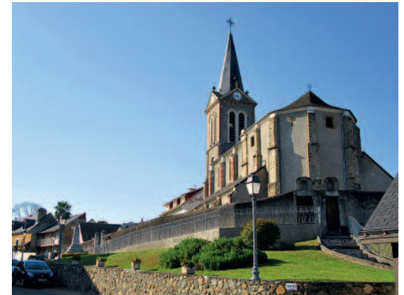
Die Kirche von Bartrès präsentiert sich im besten Licht.