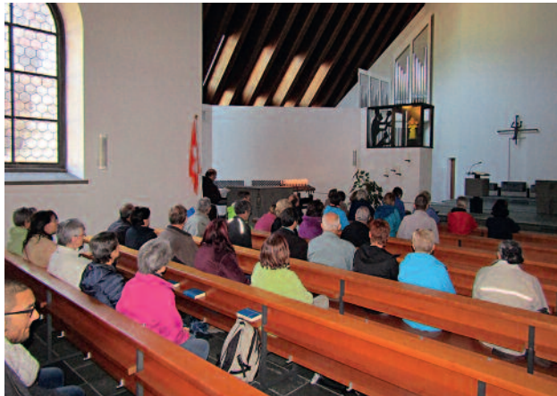
Zu Beginn unserer Fusswallfahrt besuchten wir das Sarner Jesuskind im Benediktinerinnenkloster Sarnen.